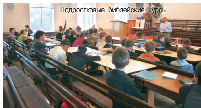
Подростковые библейские курсы

ним, путь скорбей, путь благословений, а самое главное, путь, ведущий в небо. Дети всех возрастов были собраны в одном лагере, потому что организовать несколько смен не представлялось возможным.