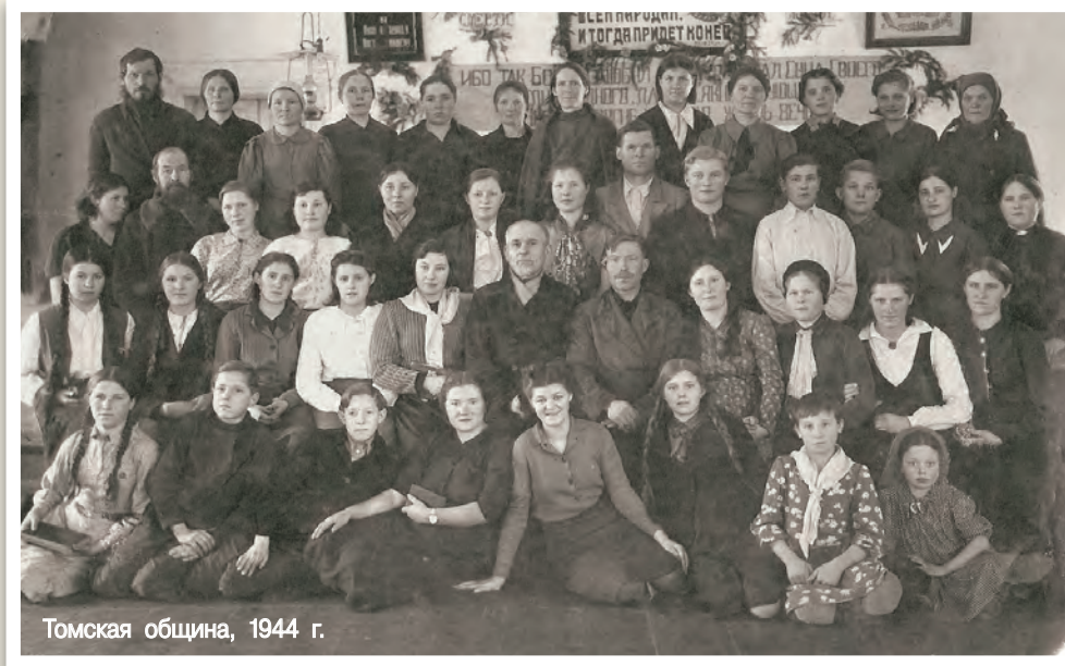
Томская община, 1944 г.

Это далеко не полный перечень проповедников и служителей Томской церкви, жизнь которых окончилась в неволе.