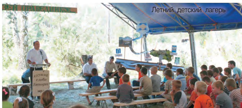
Летний детский лагерь