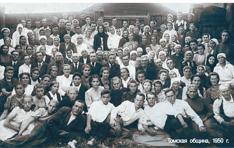
Томская община, 1950 г.